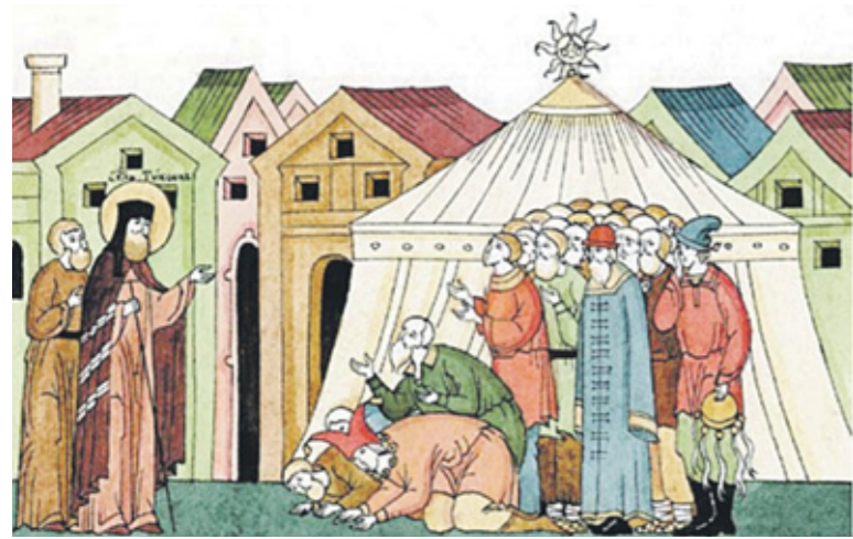
Святитель Тихон Задонский возмущает народ в праздник языческого бога Ярилы. Иллюстрация мон. Афанасия (В.Г. Ивановой)

О Сырной седмице, которую простые люди называют масленицей, мать наша Святая Церковь припевает нам, как младенцам