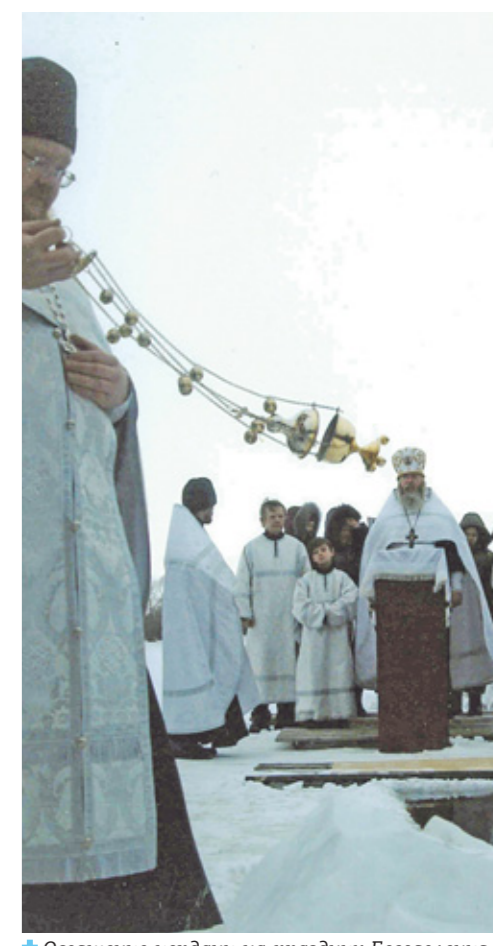
✦ Освящение иордани на праздник Богоявления в Николе-Березовке