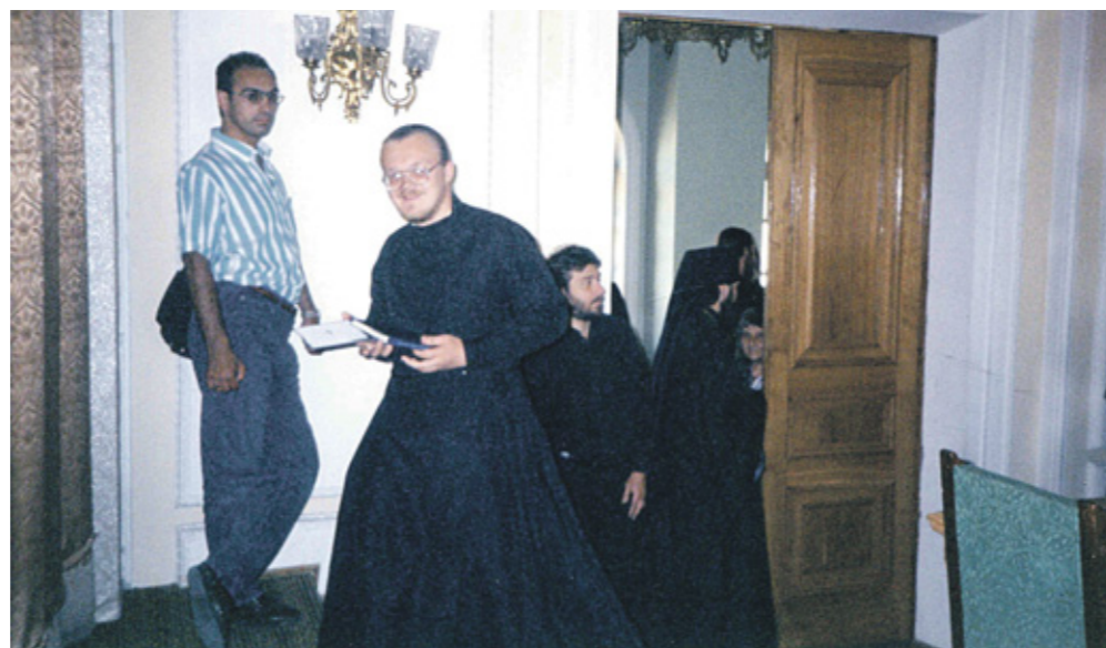
✦ Московская Духовная семинария

— Три с половиной года, если мне не изменяет память, я прослужил там. Конечно, там для меня все было ново. В Центральной России я не служил. Это был мой второй приход. Первый — в Николе-Березовке, и потом Острогжск. Конечно, интересно, необычно. Свои традиции, которые народ очень чтит,