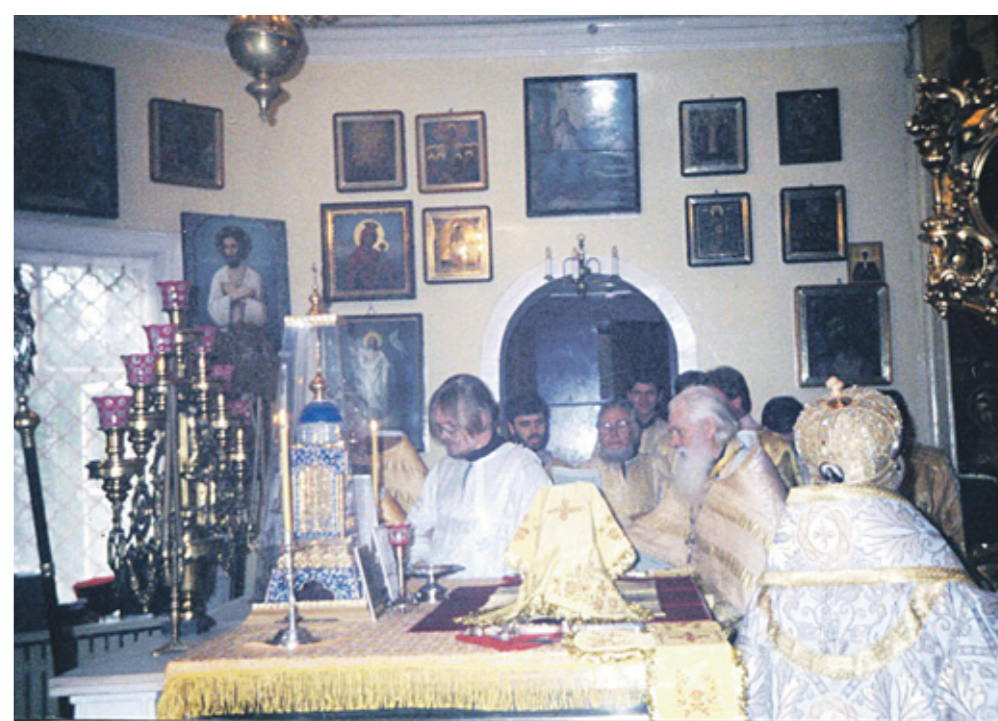
✦ Хиротония во диакона

— Для этого у нас и существует понятие «приход». Основная структурная единица РПЦ — это приход. Причем это не просто совокупность разрозненных людей, собранных вокруг одного храма. Приход — это семья. Мы к этому стремимся сейчас. И тут не важно, большой ли это собор или маленькая церковь — должна сложиться семья, приходской костяк, вокруг которого будет строить-