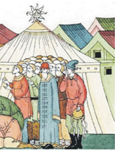
Святитель Тихон Задонский возмущает народ в праздник языческого бога Ярилы. Иллюстрация мон. Афанасия (В.Г. Ивановой)

Вот и слышим же мы из песни Свотой Церкви, и знаем, что такое масленица, а именно: начало, или преддверие, святого Великого поста. Ибо и пищу некоторую, как-то: мяса, употреблять, и браки венчать запретили. В среду и пятницу Литургии быть не дозволила ради поста, и пищи и питья повелела воздержнее касаться, чтобы понемногу привыкать к постному подвигу. И потому христианам, как истинным сынам Церкви, должно