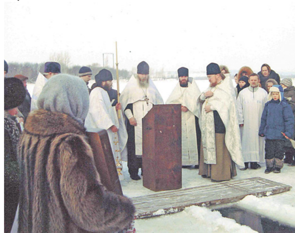
✦ Богослужение в праздник Богоявления

ся жизнь. Если не будет семьи, то все благие инициативы будут носить только разовый характер, мимоходный. Не будет и преемственности поколений. Мы к чему должны прийти? В идеале человек должен помнить, что, когда он был маленький, его родители крестили в этом храме, приводили сюда на причастие, и все возрастание этого человека должно быть неразрывно связано с этим храмом, с этой общиной. Он должен чувствовать себя там родным человеком. В больших городах, в кафедральных соборах сделать это, конечно, сложнее. Люди живут в одном месте, работают — в другом, отдыхают — в третьем. Хотя я знаю людей, которые живут далеко от собора и у которых есть храмы намного ближе, но все же приезжают именно сюда. Это сознательный выбор. Везде должен быть дух общности.