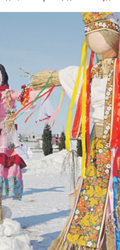
Окончание на стр. 8

сотносить их с христианством. Вокруг нас очень много обездоленных людей, ищущих тепла. Это и старенькая бабушка, живущая с вами в одном подъезде, и просто бездомные люди. Напеките блинов и угостите тех, кто нуждается. И «тогда Царь скажет тем, кто по правую сторону: «Придите ко Мне, благословенные Мои Отцом, получите ваше наследство — Царство, приготовленное вам еще от создания мира. Потому что Я был голоден, и вы накормили Меня...» (Мф. 25: 34—35).