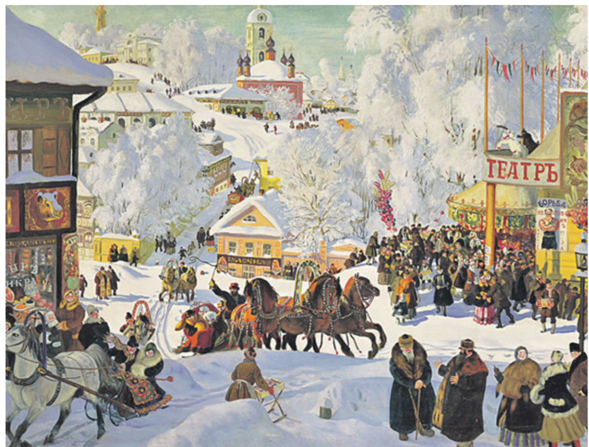
Б. Кустодиев. «Масленица (масленичное катание)». 1919 г.

своим, в песнях своих, на той седмице певаемых: «Отверзшаяся божественного покаяния преддверия; приступим, усердно очистивше телеса, брашен и страстей отложение творящие, яко послушницы Христа» и прочее. А в другом месте так: «Светлая предпразднства воздержания, светлая предпутья поста днесь». В другом месте: «Се время покаяния, предпразднственный постов вход». И еще: «Постов входы и преддверия вси да не оскверним зде невоздержанием и пьянством».