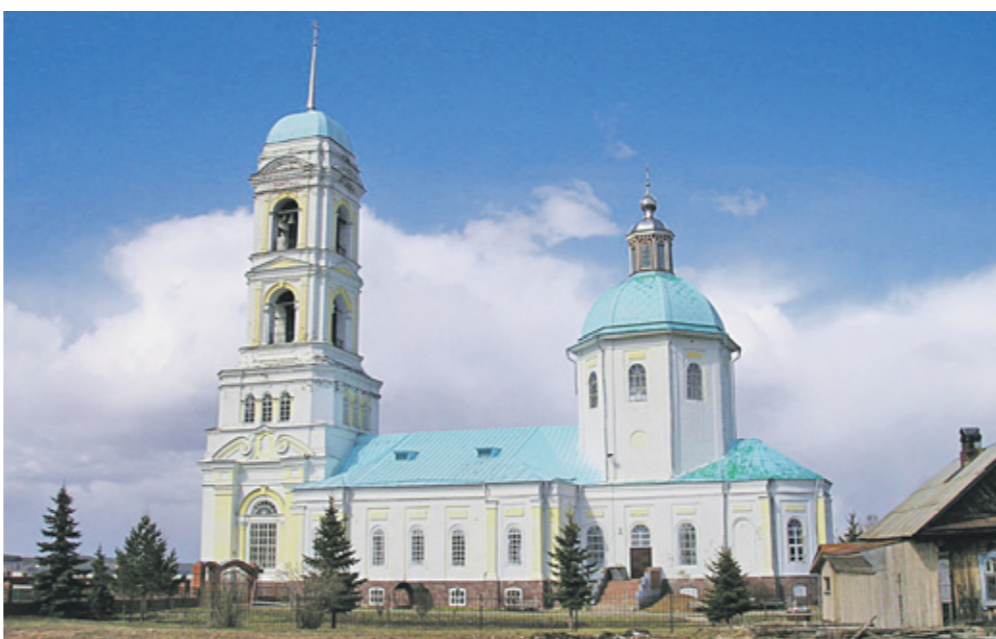
✦ Свято-Никольский храм. Село Николе-Березовка

— Конечно, первое. Там я восстанавливал святыню — Свято-Никольскую церковь. Это очень красивый храм, построенный в корабельном стиле, трехпрестольный. Честно говоря, когда я его увидел, я и не думал, что смогу его восстановить. Там ведь и села-то не было. Там была зона затопления. Жителей выселили в связи со строительством ГРЭС. Но потом строительство затихло. Основное село было за рекой. Но постепенно в течение пяти лет село начало развиваться. Президент Башкортостана Муртаза Рахимов подписал постановление о создании историко-культурного заповедника. Это нам немного помогло, особенно в плане коммуникаций, потому что все нужно было проводить заново.