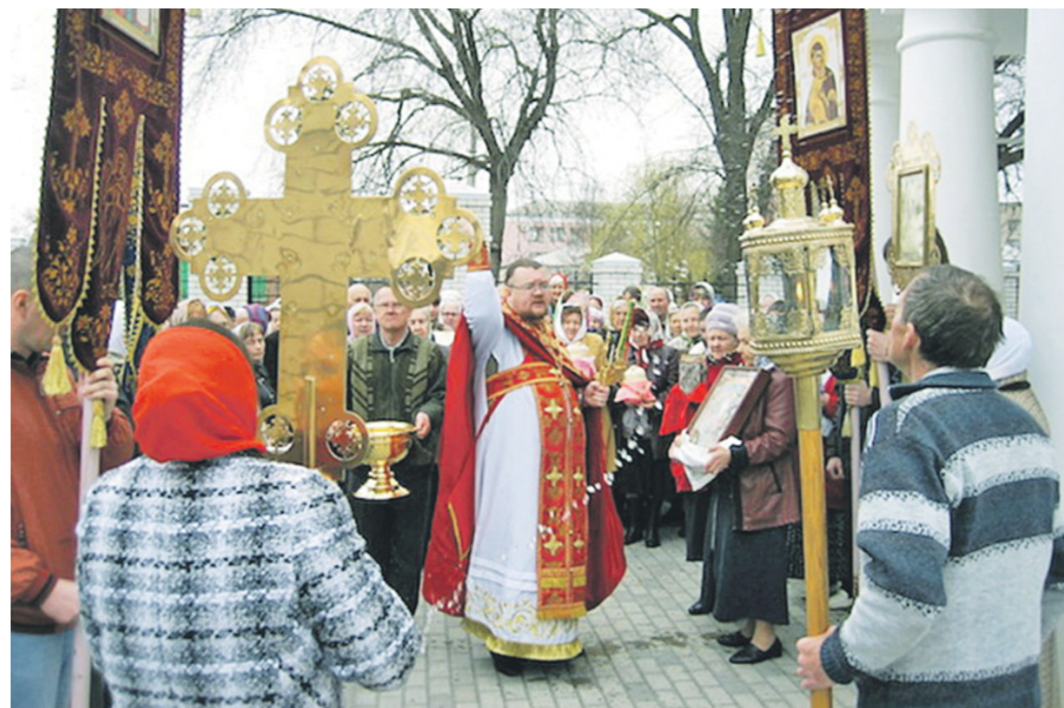
✦ Богослужение в Субботу Светлой седмицы в Преображенском храме г. Острогжска