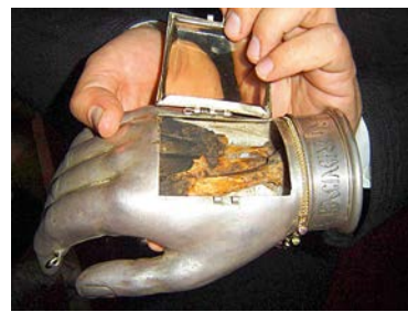
Десница свт. Василия Великого

Став епископом, свт. Василий занял строго православную